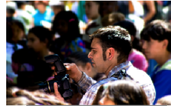
Voluntario de Santander en acción, en un reportaje realizado en Bilbao

Coordinador Local euskadi@imagenenaccion.org