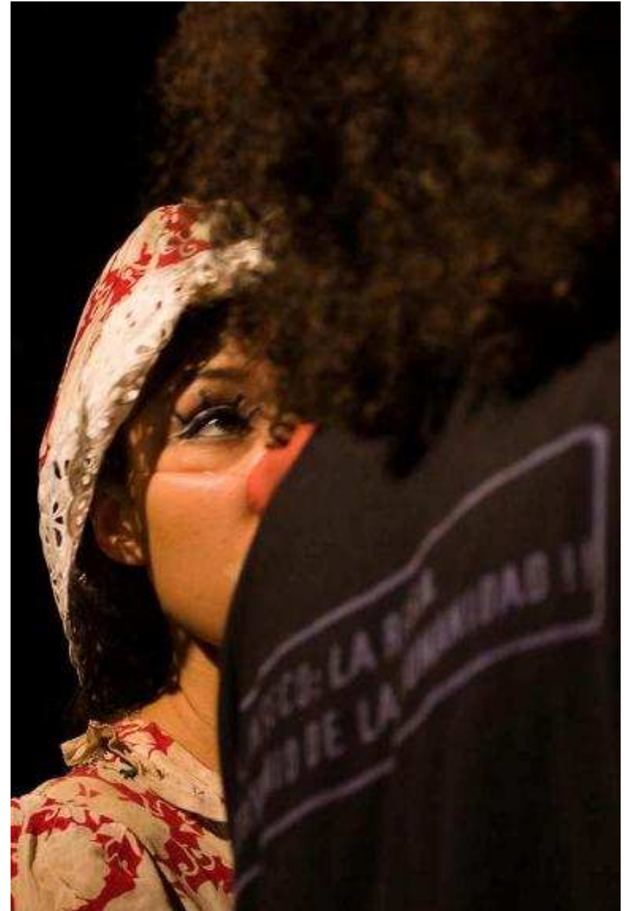
Francisco Correoso - imagenenaccion.org